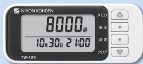
居室に設置するホームステーション(写真左)と、利用者が持ち歩く活動量計(写真右)

1951年に創業した日本光電工業株式会社は医療機器総合メーカーとして、診断や治療に役立つさまざまな医療機器を開発・販売してきました。今年11月に発売する見守りサービス「SUKOYAKA」は、同社がこれまで培った医療機器のノウハウを活かして開発した、アクティブシニアを対象とした健康増進・未病管理の新しいサービスです。