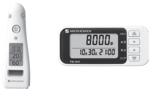
ホームステーション(写真左)を居室に設置し、活動量計(写真右)を利用者は持ち歩く

と思い、3年前から事業検討・開発を進めてきました」 高齢者に継続して使ってもらえるよう、活動量計は持ち歩くだけと機能を限定し、さらに活動度を家族が見るにあたっては、視覚的に生活パターンが把握できるようにわかりやすさにこだわった(図)。 その結果生まれた「SUKOYA AKA」は同社初となるコンシューマー向けの商品で、一般家庭や介護事業者、地方自治体などさまざまな層に向けて発売する。また、株式会社ヤマダ電機との提携により、全国のヤマダ電機店舗での販売展開も行う。